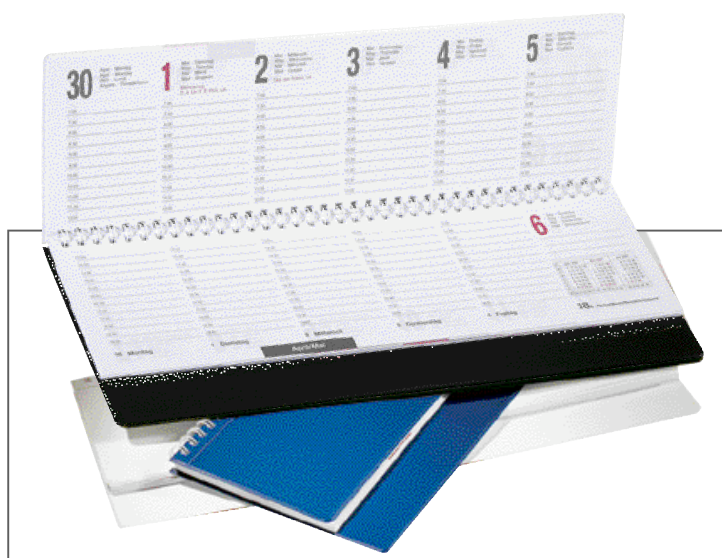
Ausführung HARTFOLIE mit sichtbarer Wire-O-Spiralbindung