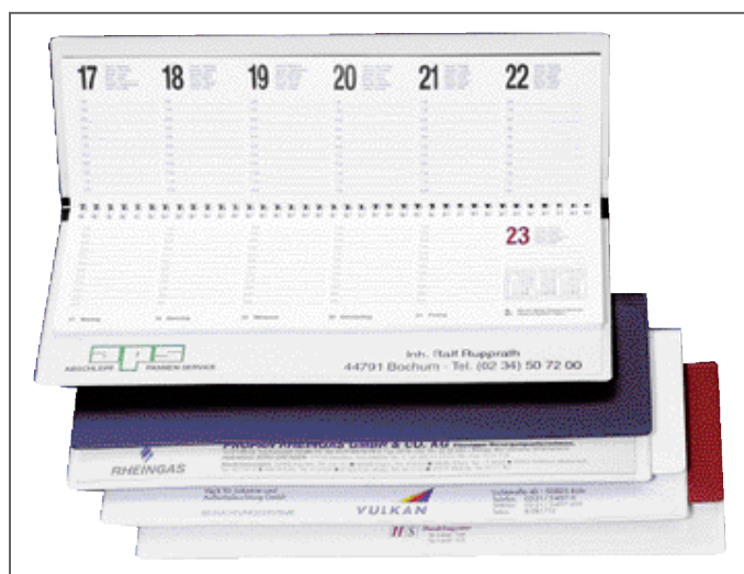
Ausführung Folieneinband BASIC CLASSIC