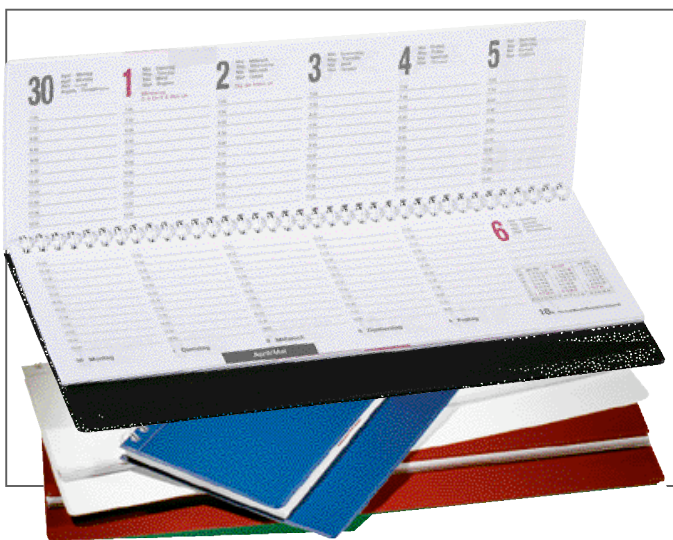
Ausführung HARTFOLIE mit sichtbarer Wire-O-Spiralbindung

Einlegen von Kunden gelieferter Kartonstreifen