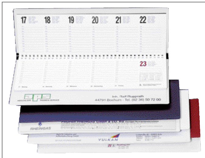
Ausführung Folieneinband BASIC CLASSIC 00-01-02-05

-,25 S ab 100 Stck. 300 x 25 mm Fußleiste