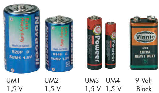
UM1 1,5 V UM2 1,5 V UM3 1,5 V UM4 1,5 V 9 Volt Block

Service, Index, Bestellscheine . . . . . ab 397 Spezialversand, Werbeanbringung, Grundkosten