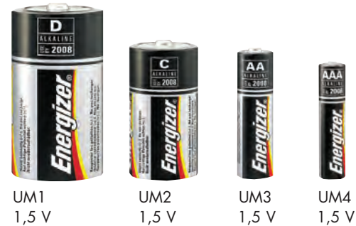
UM1 1,5 V UM2 1,5 V UM3 1,5 V UM4 1,5 V