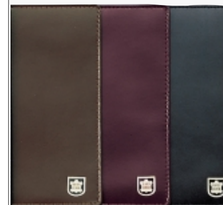
Ausführung Rindleder ARGENTINA