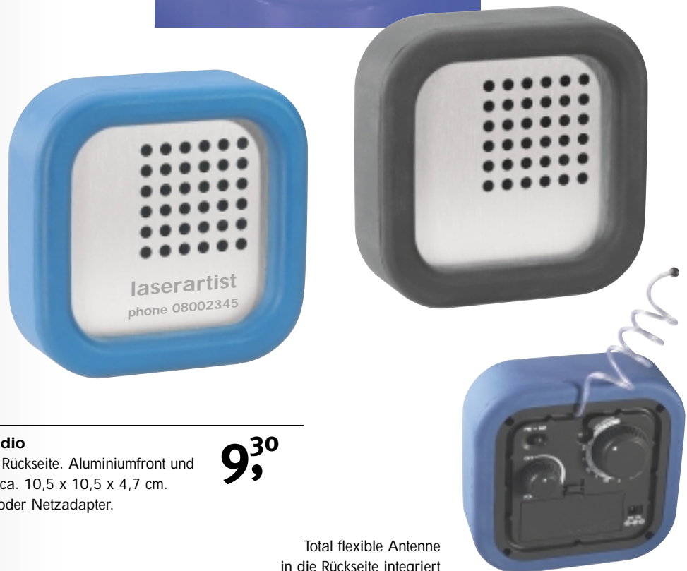
Total flexible Antenne in die Rückseite integriert